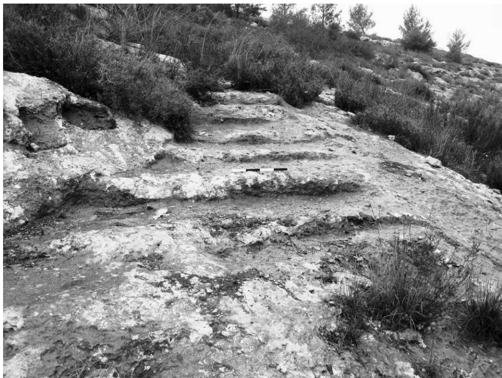
4 מעלה מדורג בנחל יתלה ("יתלה מערב")

לרגל. בשל המאפיינים הארכיאולוגיים הדומים של המעלות המדורגים החצובים ברחבי הארץ, ולמרות שלא השתמרו בידינו עדויות היסטוריות לכך שחציבת המעלות נעשתה בהוראה של סמכות ריכוזית, אנו סוברים כי החציבה אכן נעשתה על ידי או בהוראה של סמכות ציבורית כלשהי (טפר וטפר תשע"ג: 205–209; גד תשע"ג: 258–266).