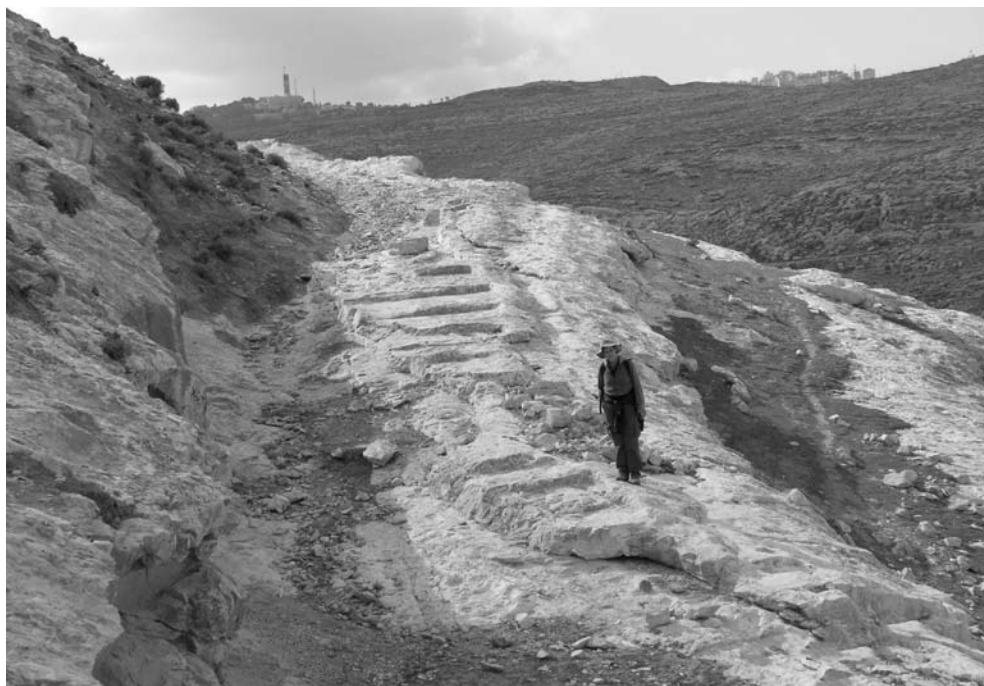
1 מעלה אדומים המדורג, נחצב לפני הסלילה הרומית האימפריאלית של הכביש ירחו-ירושלים

מאמר זה אודות המעלות המדורגים המשולבים בדרכי עולי הרגל אל ירושלים בימי הבית השני (איור 1) נשען על מחקרים קודמים של כותבי שורות אלו שעסקו בדרכים המסורתיות המובילות אל ירושלים, במעלות המדורגים לאורכן וכן במאפייני הסלילה הרומית האימפריאלית ברחבי האימפריה הרומית בכלל ובארץ ישראל בפרט (ספר ושחר תשמ"ח; ספר וספר תשע"א; ספר וספר תשע"ג; ומראי מקום נוספים שם). כחלק ממחקרים אלו, נבחנו היישובים לאורכן של הדרכים וכן