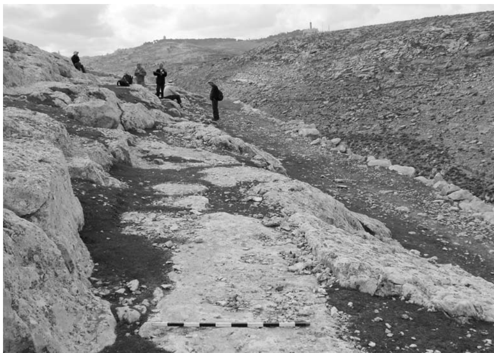
7 המעלה מיריחו לירושלים: משמאל דרך עולי הרגל ("מעלה האדומים") חצובה ומדרגת ברוחב עד 2 מ', מימין קיר התמך המאסיבי של הכביש הרומי האימפריאלי, יריחו לירושלים.

רול (תשמ"ז: 122). זוהי עדות היסטורית המאששת את הממצא הארכיאולוגי ומוכיחה כי הדרך ולפיכך גם המעלה החצוב בה שימשו את ציבור עולי הרגל אל ירושלים עוד טרם הסלילה הרומית האימפריאלית. כאמור, את הסלילה האימפריאלית ניתן לתארך באמצעות אבני המיל המופיעות לאורכה ומציינות את שם הקיסר שבימיו נסללה או שופצה הדרך (טפר וטפר תשע"א: 280–281; טפר וטפר תשע"ג: 22–29). לכבישים הרומיים האימפריאליים בארץ ישראל מאפיינים ארכיאולוגיים דומים לאלה של כבישים רומיים בחלקים אחרים של האימפריה הרומית, ומבדילים אותם מן הדרכים המקומיות. כך למשל, הכבישים הרומיים סלולים ברוחב קבוע עם ריצוף מעל שכבת מילוי, עם קירות שוליים איתנים ואבני מיל מוצבות לאורכם. יש להדגיש כי חציבת מדרגות איננה