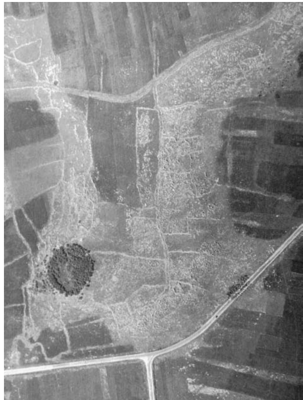
6 צילום אוויר של הכביש המנדטורי ו"צומת גולני" המודרנית (בחלק התחתון), ובתוואי דומה, ממערב למזרח, הכביש הרומי האימפריאלי עכו-טבריה (בחלק העליון של הצילום). בנוסף ניתן לראות שלב סלילה קדום בכיוון צפון-דרום, המזוהה עם דרך עולי הרגל (טפר וטפר תשע"ג: איור 25).

היא אחת מדרכי עולי הרגל בימי הבית השני שהובילה מהגליל לירושלים וכי יש לתארך את החציבה של גרמי המדרגות לאורכה לפרק זמן זה. על גבי דרך זו נסלל מאוחר יותר הכביש הרומי האימפריאלי מעכו וציפורי לטבריה (איור 6). הממצא הארכיאולוגי במקום מצביע על שני שלבי סלילה שונים, כאשר הדרך הקדומה נסללה בכיוון צפון-דרום ושימשה במערך הארצי של דרכי העלייה לרגל אל ירושלים, בעוד שהכביש הרומי נסלל בכיוון מזרח-מערב, מעל הדרך הקדומה (רול תשנ"ב: 33–35; טפר וטפר תשע"א: 281–282, איור 67; טפר וטפר תשע"ג: 82, איור 25). קטעי הדרך החצובים במדרגות המוכרים ביותר לציבור המטיילים ולחוקרים מצויים דווקא בדרכים המזוהות ככבישים רומיים אימפריאליים, דוגמת מעלה