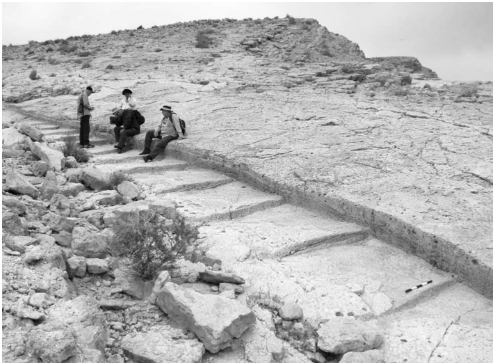
8 קטע דרך מדורג במעלה העקרבנים המציין שלב כרונולוגי קדום במעלה זה

בניגוד לכבישים הסלולים של האימפריה הרומית, דרכי עולי הרגל לירושלים בשלהי ימי הבית השני נועדו למעבר של הולכי רגל ולא למעבר של תחבורת עגלות או מרכבות. רגל הינו כמובן גם מועד של חג, שבו המוני בית ישראל עלו לבית המקדש