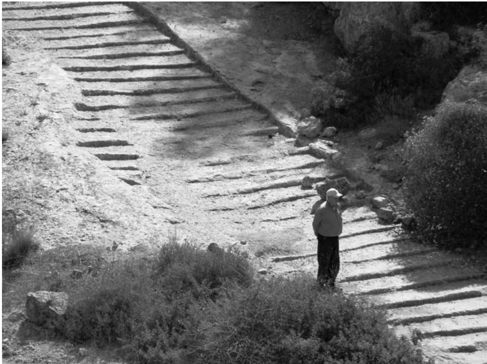
5 מעלה חנות (מטע) ובו מדרגות חצובות. ראו סרפנטינה חצובה בדופן השמאלית המציינת שלב קדום בתולדות המעלה

ירושלים, לצד מערכות הדרכים הקדומות והכבישים הרומיים האימפריאליים שיעדם ירושלים, לפי הדגם של הסקר הארכיאולוגי שנערך לאורך הכביש הרומי מיפו לירושלים. באזור זה זוהו במחקרים קודמים כבישים רומיים אימפריאליים, העולים משפלת יהודה ושפלת לוד אל ירושלים במעלה בית חורון, במעלה חנות (איור 5) ובמעלה מצד (פישר, איזק ורול 1966). מכיוון שכמה מן המעלות החצובים הנידונים לעיל נחצבו בתוואי שלאורכו נסללו, בשלב מאוחר יותר, כבישים רומיים אימפריאליים (במרחב הארץ – ישראלי), הניחו החוקרים שמעלות אלה נחצבו על ידי הרומאים. באופן זה, הפכו המדרגות למאפיין שמזהה את הסלילה הרומית האימפריאלית הסטנדרטית בארץ ישראל (הראל תשי"ח; קלונר 1996; רול 2005).